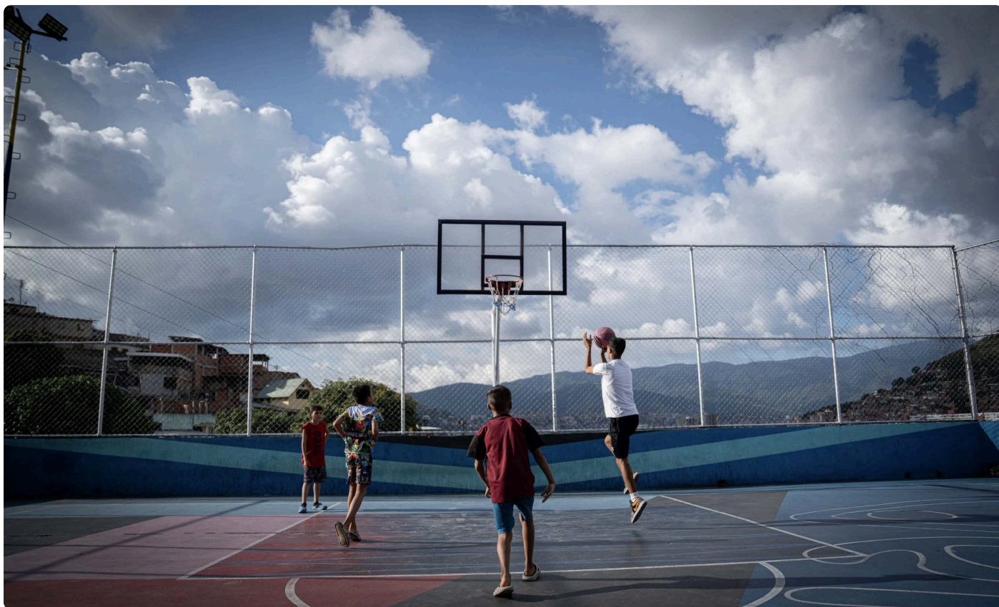
Cancha de Basquetbol en la altura de La Vega.