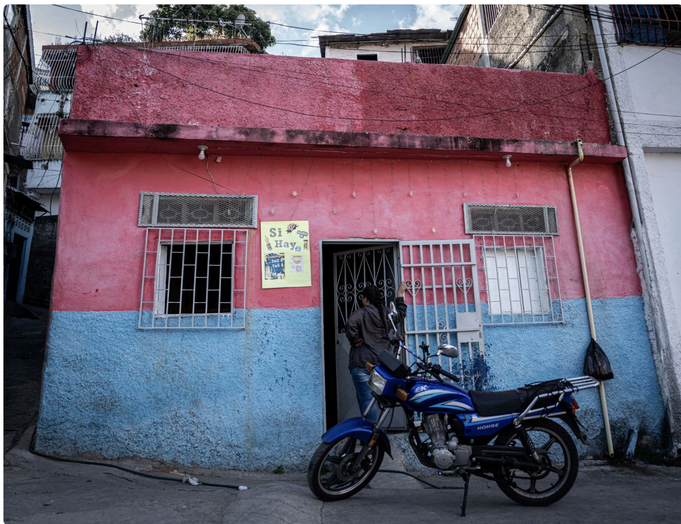
Pequeño local comercial de La Vega.