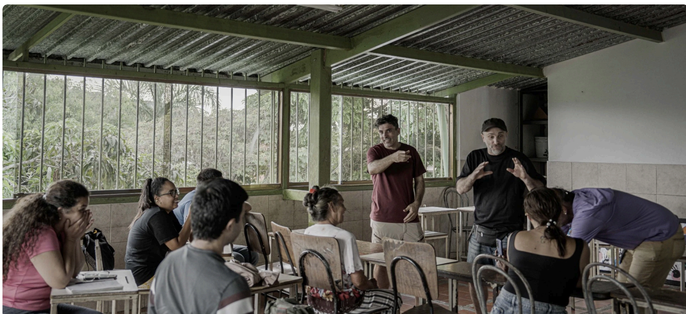
Taller abierto de cine documental en el marco del Festival de Cine de la Vega.