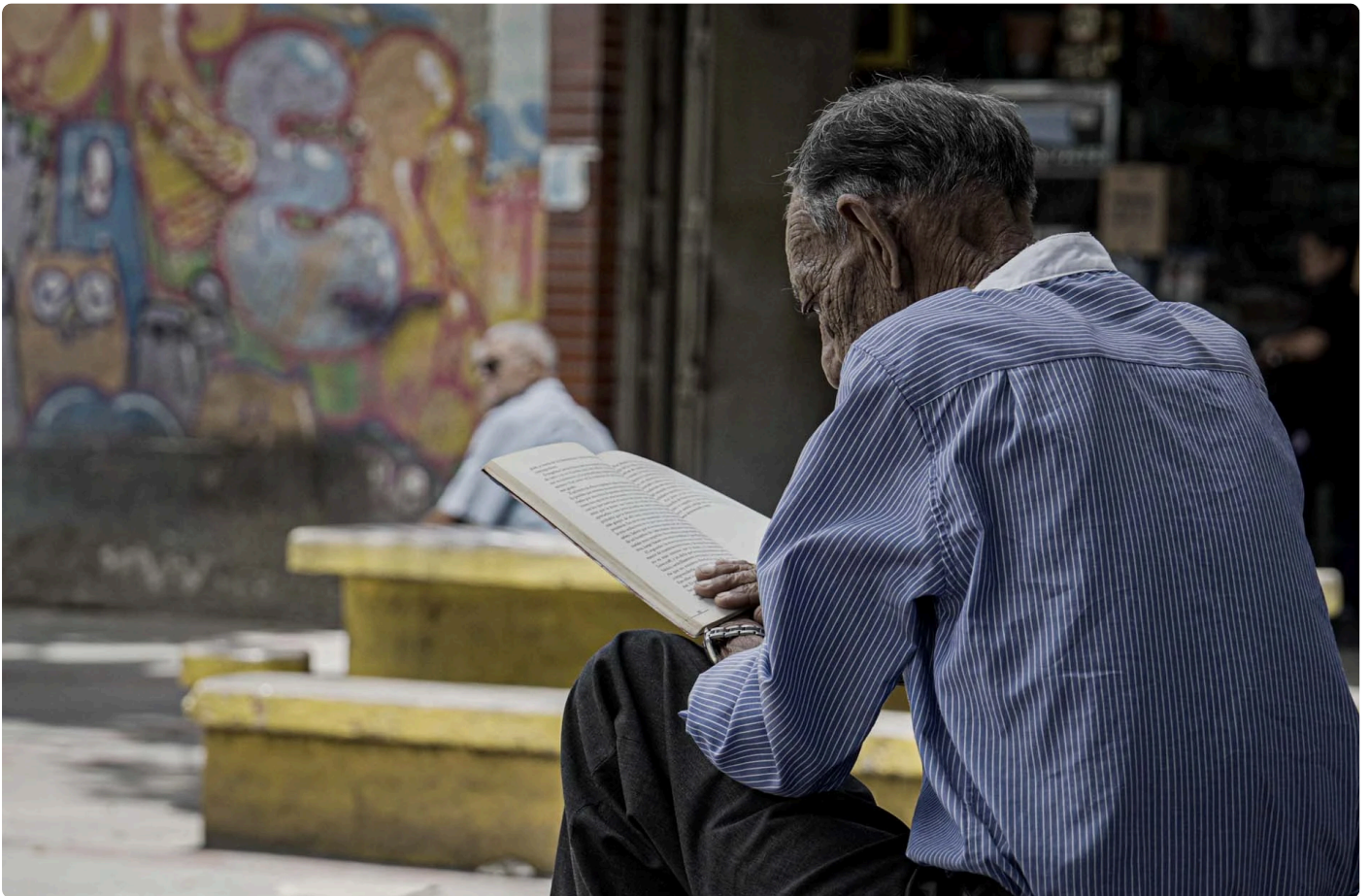
Hombre leyendo en la calle.

Esa fue la época de mayor migración de los venezolanos. Se estima que hubo una diáspora de más de 6.000.000 de venezolanos a todas partes del mundo. Es así como todas las personas tienen algún familiar o amigo fuera del país.