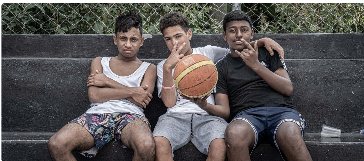
Los "chamos" en la parroquia de La Vega.

De a poco se fueron integrando el resto de los documentalistas que llegaron de Cuba. En un salón comunitario nos esperan para comer. Unas viandas, envases de plástico con pollo, arroz y plátanos fritos. Comemos juntos hasta que irrumpe una delegación del partido del presidente Nicolás Maduro. Una mujer joven e imponente con actitud militar se acerca con un grupo de seguidores y cámaras para saludarnos. Noto una cierta tensión. Otra vez vuelven los fantasmas que nos suelen llegar desde los noticieros. El exceso de querer convencernos de la revolución es algo que no me cierra.