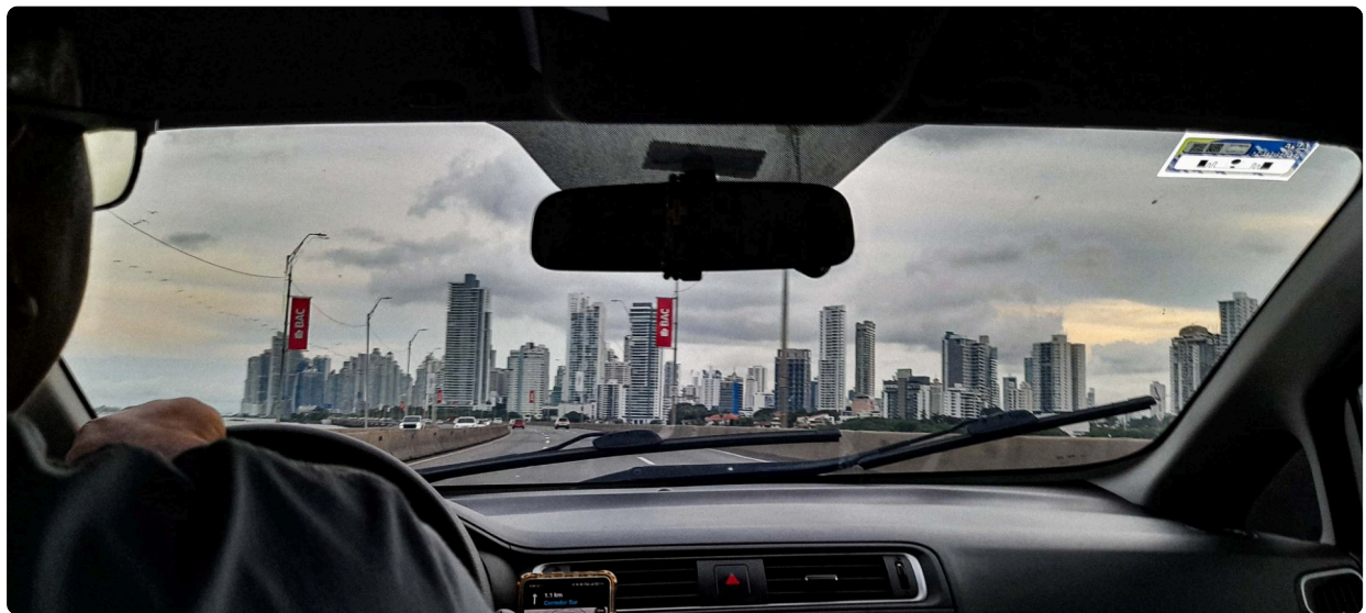
Vista desde Vía Tocumen hacia Ciudad de Panamá.

Salir de la realidad cotidiana es reencontrarnos con nuestras vulnerabilidades , dijo Mitchell uno de los realizadores cubanos que participó del encuentro. Lo imprevisto, lo que simplemente sucede. Es lo que le da cierta magia al documental.