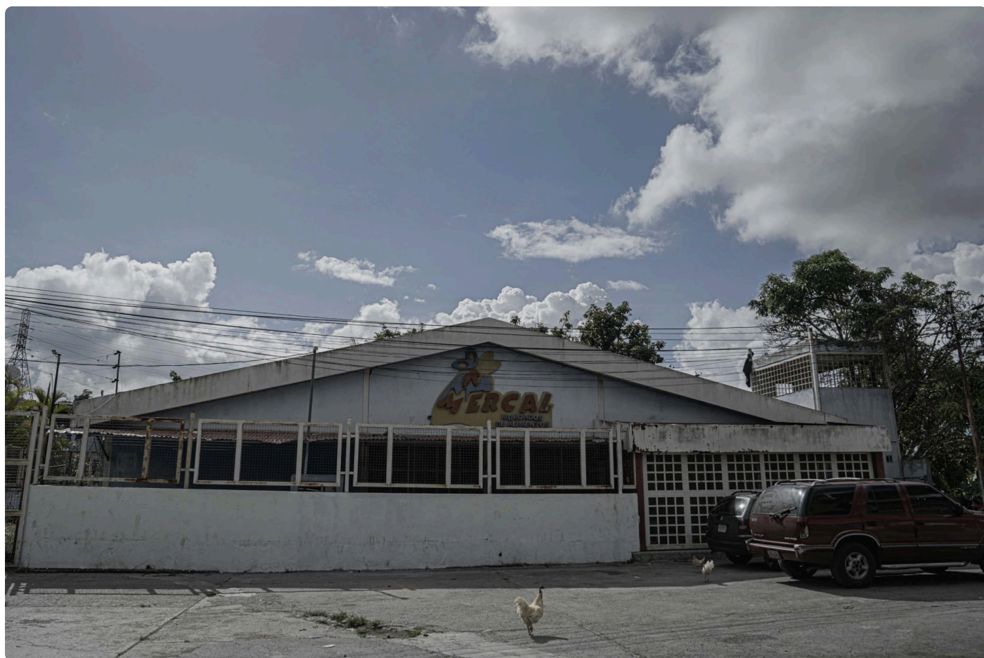
Supermercado Estatal Mercal. Donde se repartían alimentos durante el bloqueo.