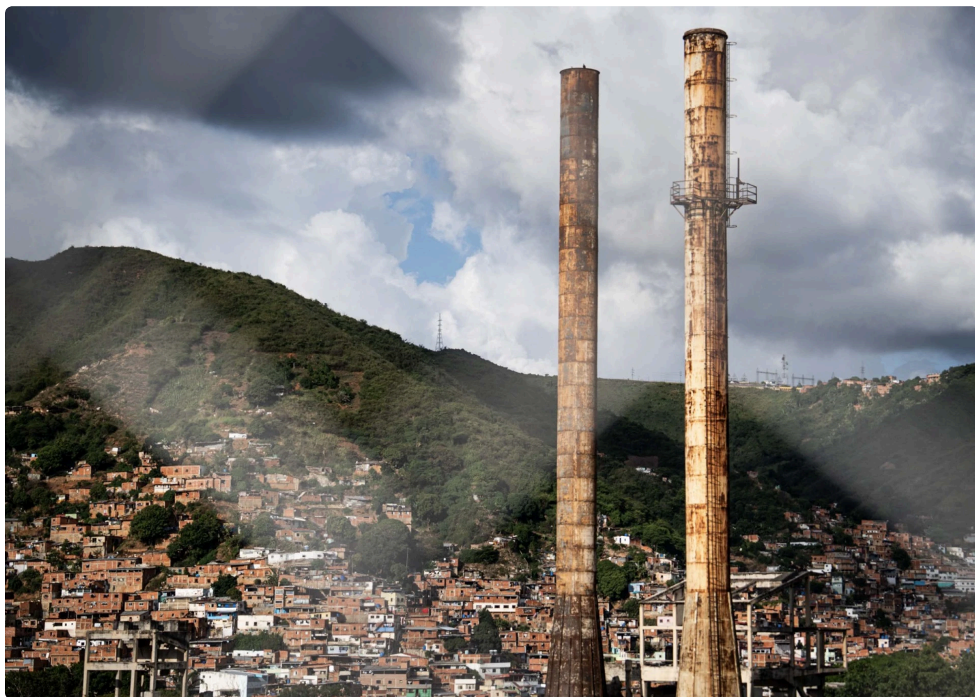
Las chimeneas de La Vega, ex fábrica de cemento.