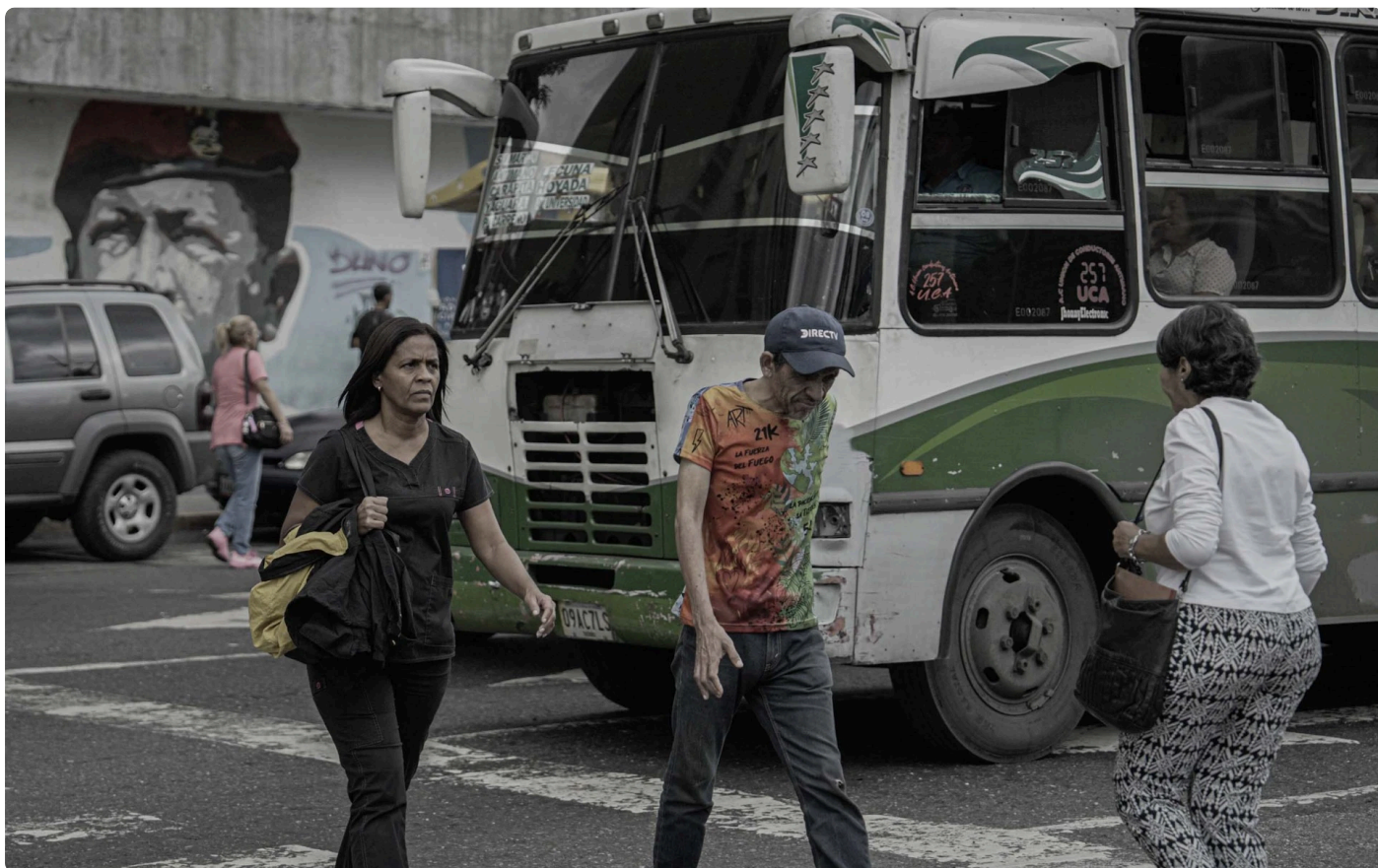
Peatones y bus en Caracas.