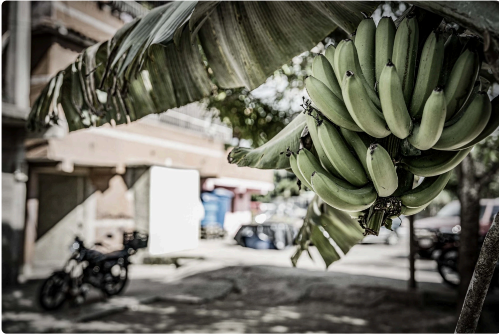
Racimo de Cambur.

Volviendo de la playa, la consigna fue hacer una ronda con relatos de fracasos. Cada uno debía contar una historia de amor malograda. Después de contar la propia, Eliezer cuenta que durante la época del bloqueo la cosa estaba bien difícil y con tan mala suerte que la novia queda embarazada, vaya momento a tan solo un mes de iniciar la relación. Sin dinero, Eliezer tendrá 24 horas para obtener la pastilla "del día después" y lograr que su novia la tome para evitar el embarazo. El tiempo corría y se le hacía cada vez más difícil dar con la bendita pastilla.