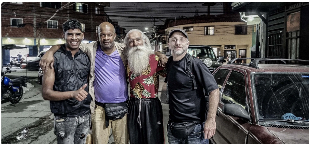
Volviendo luego de presentar Tiempos Circulares, junto con Francisco coordinador. Y Papá Noel de civil.

para regalarme un agua mineral o directamente te ofrecen agua de coco bien helada que es deliciosa. Así sin preguntar nos ofrecían unos besitos de coco, unas galletitas de coco muy ricas. Pero el trago privilegiado del pueblo es el Cocui , una bebida alcohólica fermentada que se remonta a tiempos prehispánicos, donde las poblaciones indígenas, ya utilizaban la planta de agave cocui en rituales y como medicina. En la crisis del bloqueo el pueblo no tenía ni para tomar una cerveza y comenzaron a hacerse sus propias bebidas recuperando ese saber ancestral. En las calles se veía a la gente tomando en botellas de plástico. Antes Chávez ya había promovido esta bebida, que luego fue reconocida como Patrimonio Cultural y Ancestral de Venezuela, con denominación de origen, destacando su importancia cultural y económica en la región.