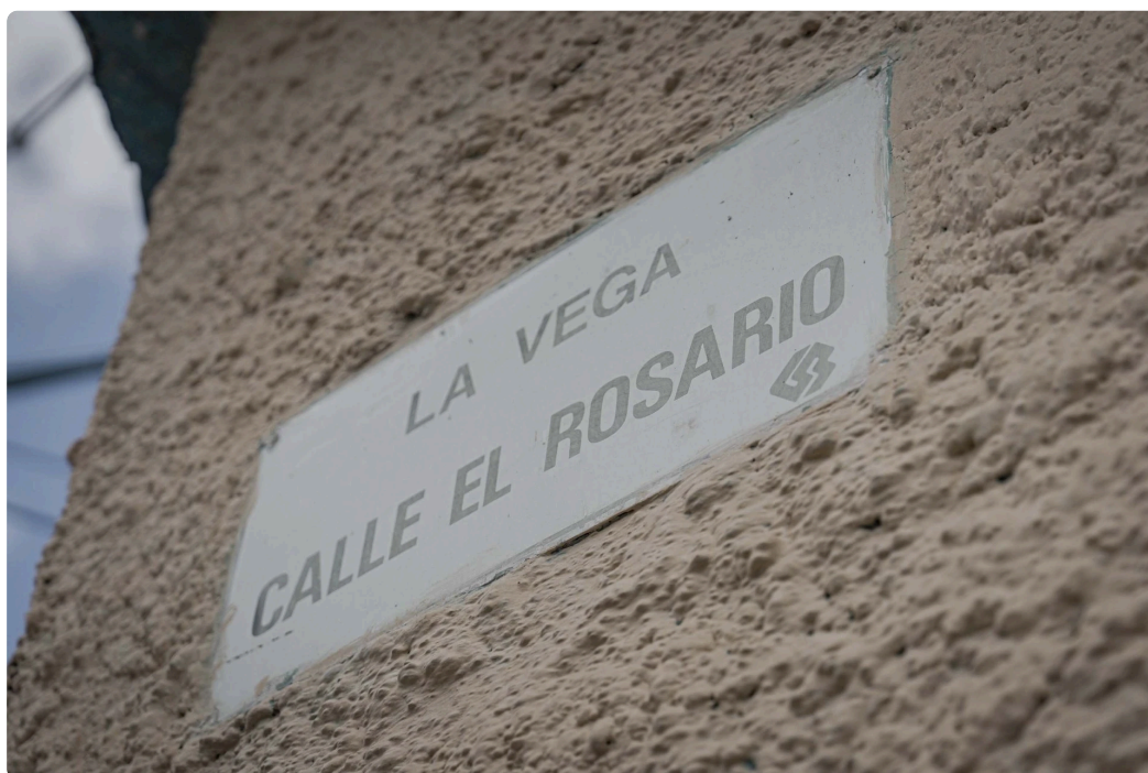
Señalética calle El Rosario.

El lugar es tranquilo mucho más tranquilo que en muchos barrios populares de Argentina. Los niños se acercan a saludar. Empiezan diciendo "che boludo" con un