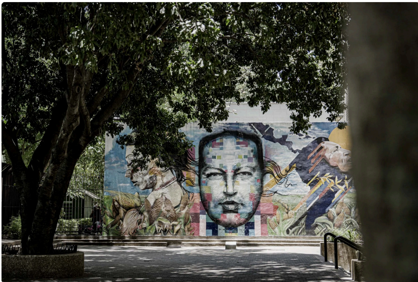
Mural Chávez.