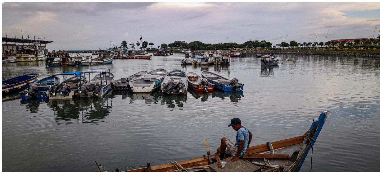
Puerto y mercado de comida en Panamá.

Aterrizamos en el aeropuerto de Caracas. Los temores y fantasmas volvieron. En migraciones todo es nerviosismo, preguntas y más preguntas. Comienzan a hacerse llamados entre ellos, lo cual inexorablemente nos hace sentir sospechosos. No tendría que haber dicho que era periodista justo el día anterior a las elecciones internas en Venezuela. "Que yo sea paranoico, no quiere decir que no me estén siguiendo" es la frase que tengo en el whatsapp. Todos los prejuicios con los que cargamos parecen confirmarse. Cagamos, acá quedamos detenidos . Por otro lado, pienso, cuando uno entra a los EEUU o a Europa es más o menos lo mismo.