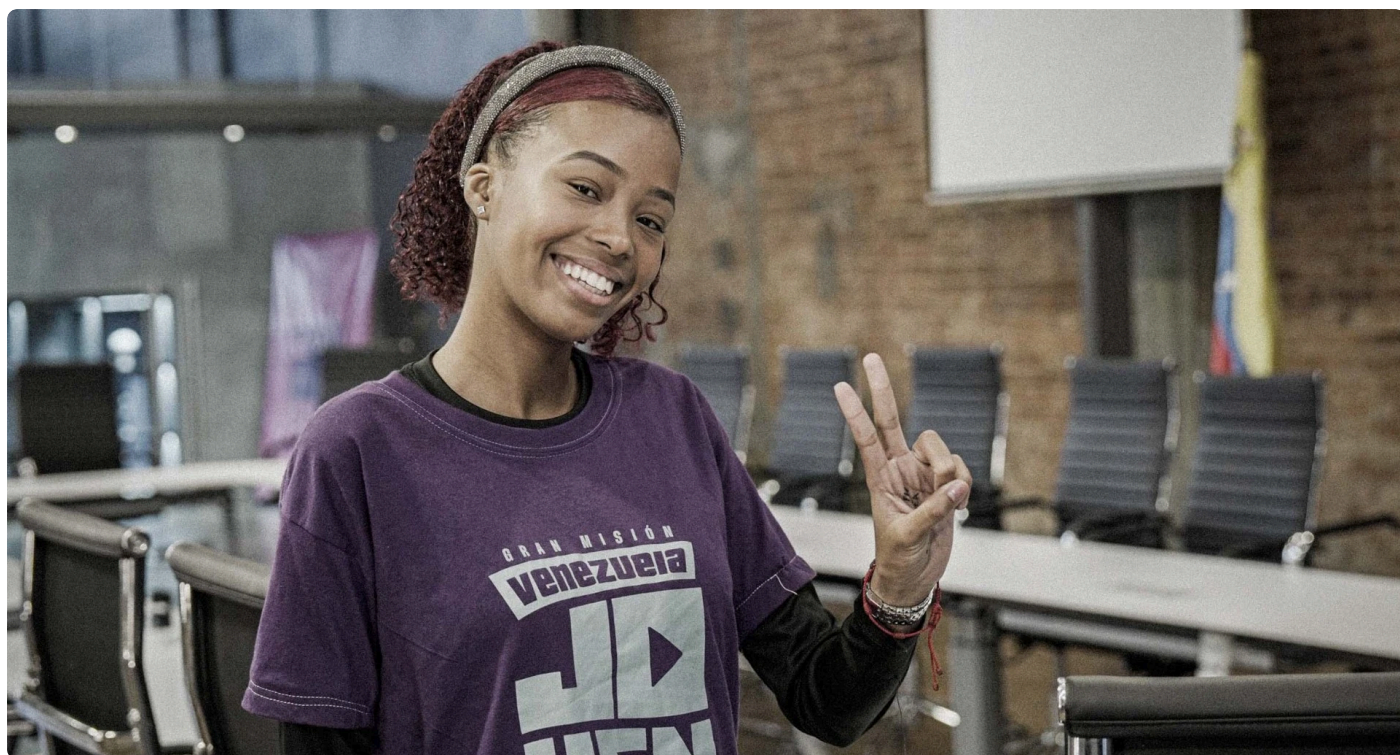
Encargada de espacio juvenil para promover el estudio y la ciencia. Contenta de su trabajo.