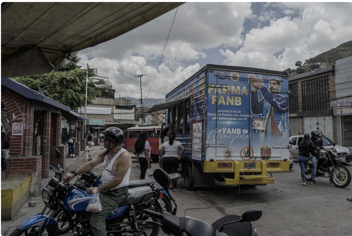
Fuerza Armada Nacional Bolivariana (FANB) que consiste en la creación de espacios (farmacias físicas y móviles) para garantizar el acceso a medicamentos.

huevo. Cómo le llevo yo esta mierda de pastilla para allá. No había camioneta, se estaba haciendo de noche y el tiempo va contando hermano. Mientras más avanza el tiempo, menos efectivo es esta vaina. No me puede estar pasando esto. ¿Qué hago con esta mierda corriendo así? y de repente veo un tipo y le digo hermano, ¿para dónde vas? Voy para Coto. ¿Me llevas le digo? No, no, no, yo no te conozco, me dice. ¡Pero bueno le digo, chamo voy a entregar una pastilla de emergencia! Bueno me dice, pero te vas en la Cava, (en una especie de camioncito destartalado enganchado al auto) - de una le digo. Y acaba por ser un carro de pollo. Así es "Zanahoria" voy en la parte trasera de un remolque que llevaba un tufo a podrido que no te imaginas. Conectado a un puto gancho por la autopista, marico con dos pastillas en el bolsillo y con la vida en el cuello.