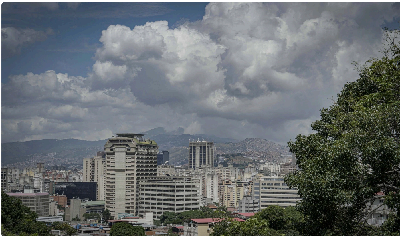
Centro Ciudad de Caracas. Foto: Fernando Mercado