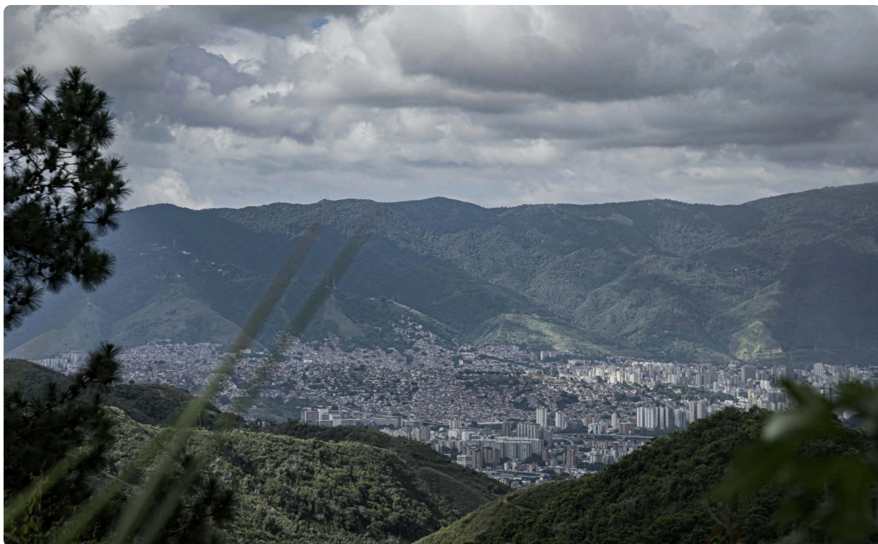
La inmensidad de Caracas.

Quiero destacar y lo voy a hacer las veces que pueda, lo maravilloso que es este pueblo. El buen humor, el arte, la música que llevan dentro. El respeto y su nivel de educación. Aunque se les nota un cierto cansancio y las ganas de salir adelante que lamentablemente no llega. Tienen fe que esto va a mejorar y realmente dan muchas ganas de que así sea.