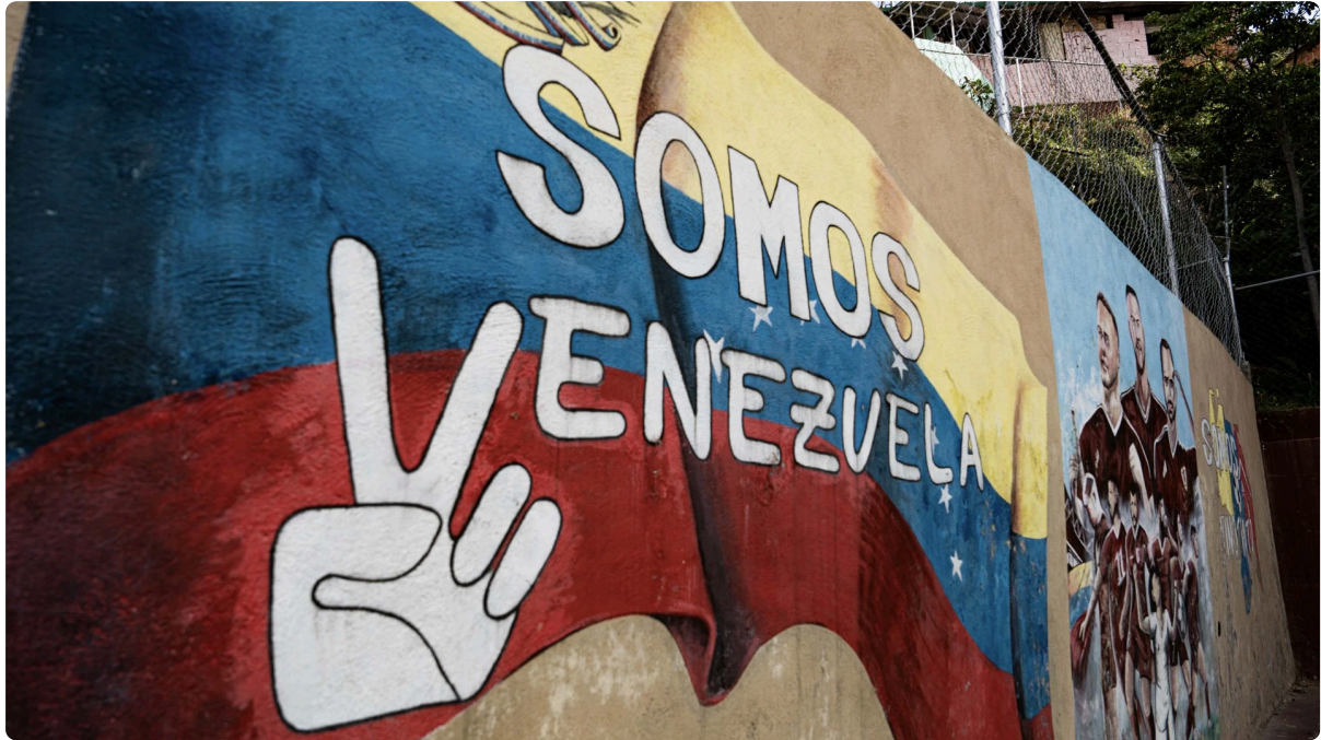
Caracas es una ciudad cargada de murales por todos lados, Chávez, la revolución, Simón Bolívar.

Quizás es que estamos recién llegados y quieren contarnos toda su pasión de una vez. Y por eso me parece que es hora de comenzar a preguntar.