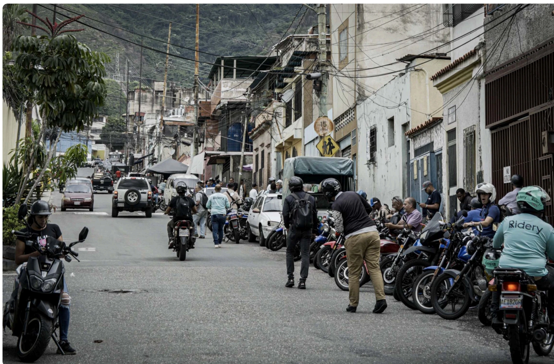
Motos haciendo cola para cargar gasolina.

Llama la atención las filas y filas para cargar nafta. Según nos dicen, son hasta dos tanques por mes por vehículo subsidiado. Luego cada uno paga. El taxista nos contó que una amiga que trabaja en una estación de servicio le carga gasolina gratis y solo así le cierra el negocio. Igual está estudiando fisioterapia para en el futuro vivir de eso. Todos estudian en Venezuela. Tienen uno o dos títulos por persona, aunque después trabajen de lo que sea. Hugo Cháves y Simón Bolívar están presentes en todos lados. En los murales, carteles y en el corazón de la gente