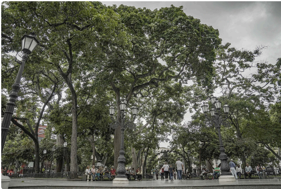
Plaza Bolívar de Caracas.

Vuelvo y le digo: Mira, vamos a hacer una cosa, le dije bueno, toca pastilla de emergencia. Entonces arranqué a buscar esa pastilla de mierda que en esa época no se conseguía aquí en La Hoyada de Caracas.