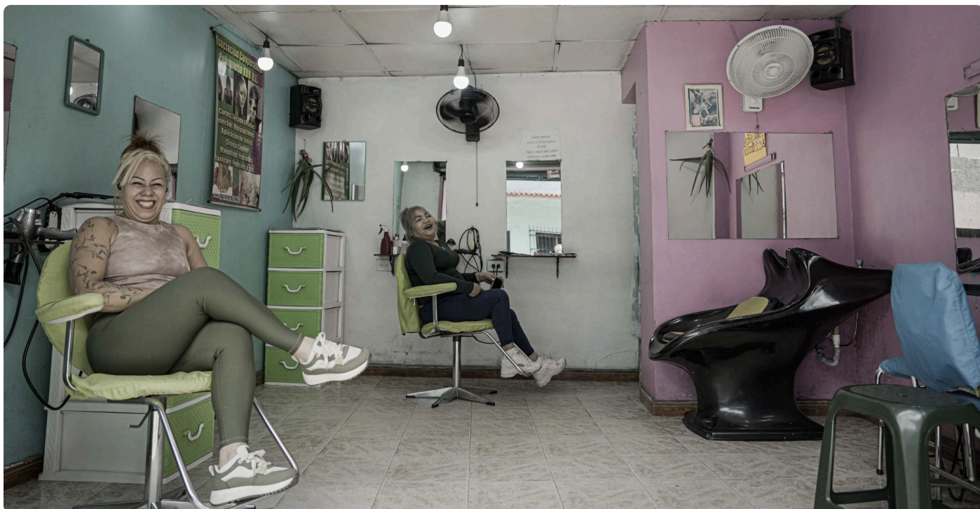
Peluquería con entrada abierta de la vía pública. Felicidad y música constante.