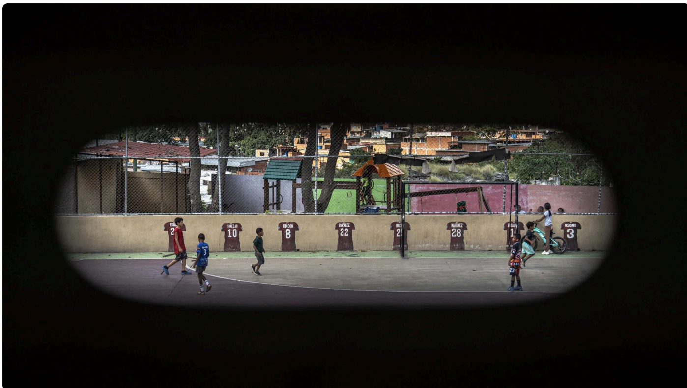
Espacio deportivo parroquia (comuna) La Vega.