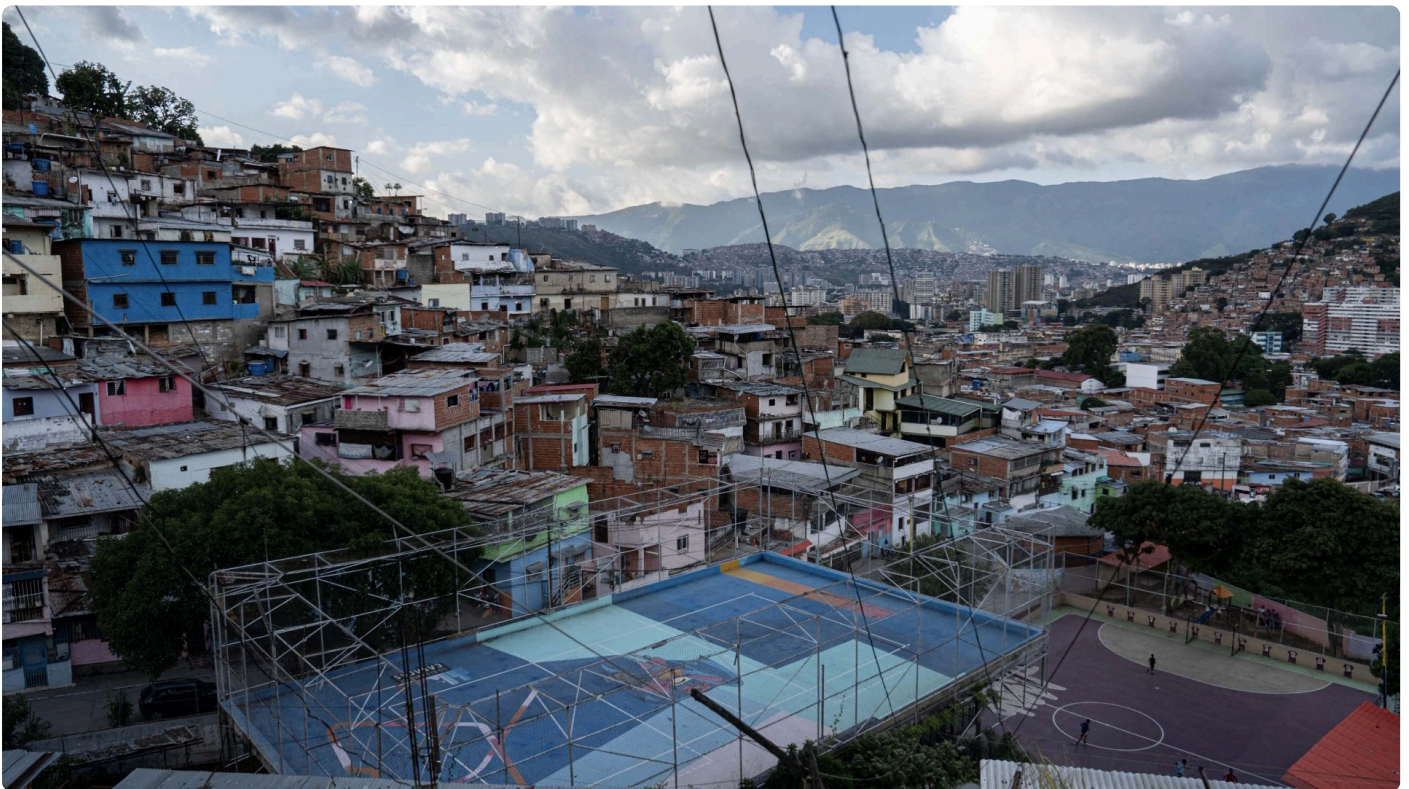
Vista desde la parroquia (comuna) La Vega.

La Ciudad de Caracas es como un gran estadio de fútbol cuyas tribunas son miles de casas que circundan y se ubican a lo largo y ancho de las montañas. Abruma e impresiona. Pero lo que más impacta es el tremendo caos del tránsito. Siempre pensé que una sociedad se puede analizar por su forma de conducir. Nos pasaron trescientas motos por los costados sin respetar un solo semáforo. Así y todo, nadie se insulta, ni parece inmutarse. El conductor que nos llevaba se cruzó intempestivamente frente a un colectivo, me acurruque esperando el impacto, pero al final no pasó nada. Seguir las reglas del tránsito parece ser lo más peligroso. Hay un enfrentamiento explícito entre autos, motos y colectivos. La pugna es permanente. Las motos, aunque parecerían las más débiles ganan en número y son más poderosas.