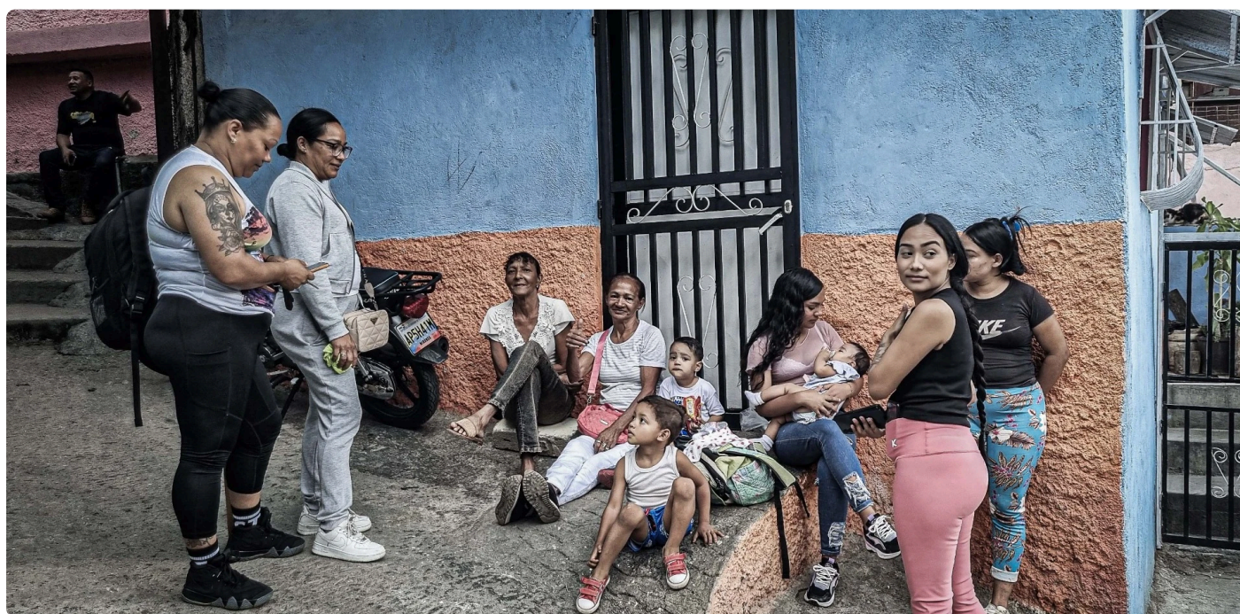
La gente reunida disfrutando en el barrio de La Vega.