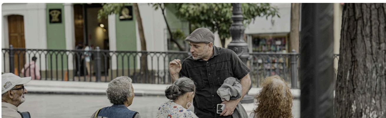
Hablando con la gente en Plaza Bolívar de Caracas. La señora me cuenta de la Orquestas y Coros Juveniles e Infantiles "El Sistema". Fundado por José Antonio Abreu.