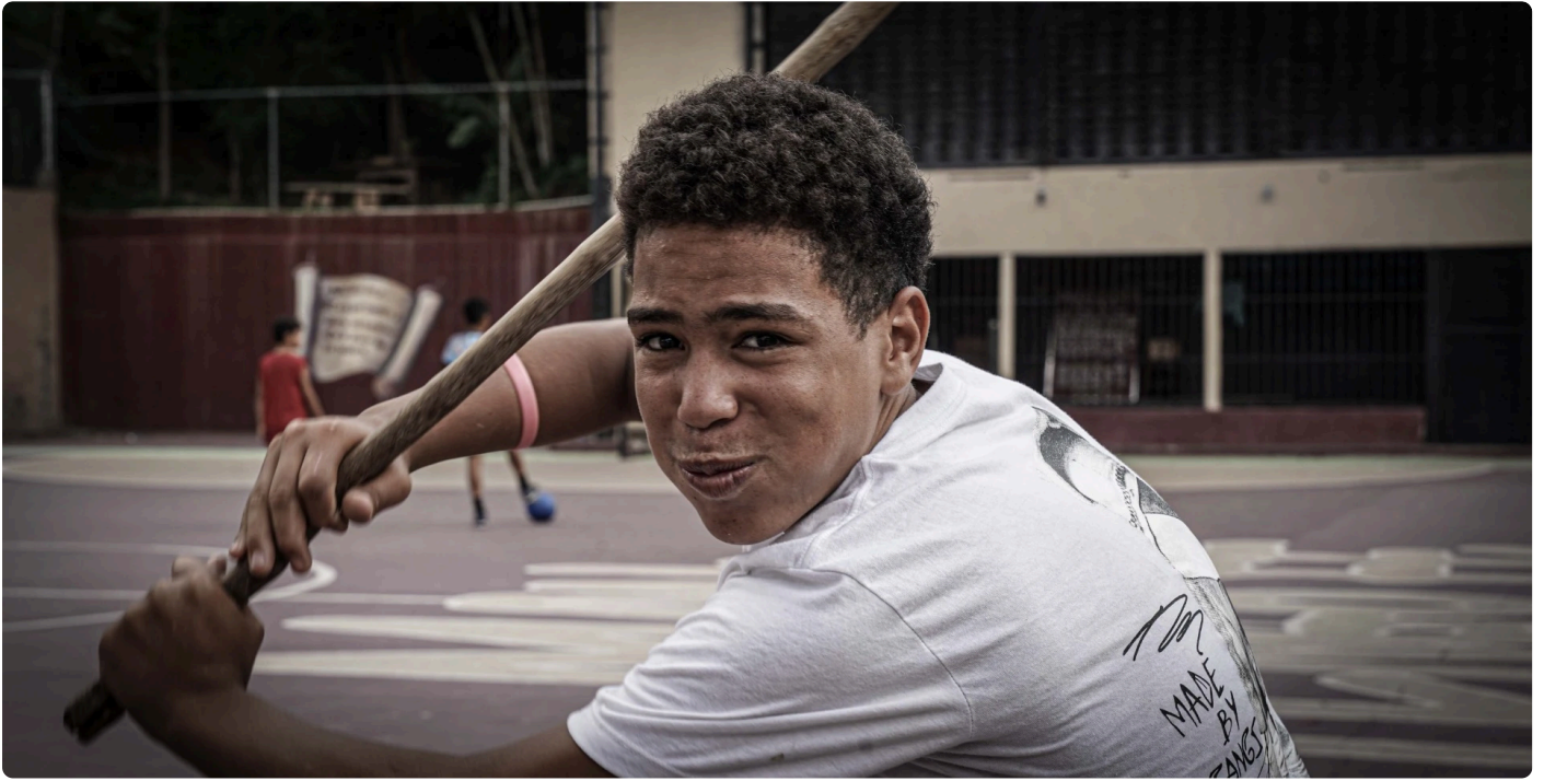
Joven jugando baseball, en la cancha de La Vega. Todo el tiempo decía “qué mirá, bobo”.

exagerado acento porteño. Preguntan por Messi, sin faltar la frase "Qué mirá, bobo", que les encanta. Es impresionante ver esa cancha de fútbol elevada en la altura. Unos chicos juegan baseball con un simple palo de escoba y me sorprende al ver cómo impactan con una pelota de tenis desgastada haciendo un tremendo home run , sacando la pelota de la cancha. Festejamos todos juntos espontáneamente como si fuera un gol.