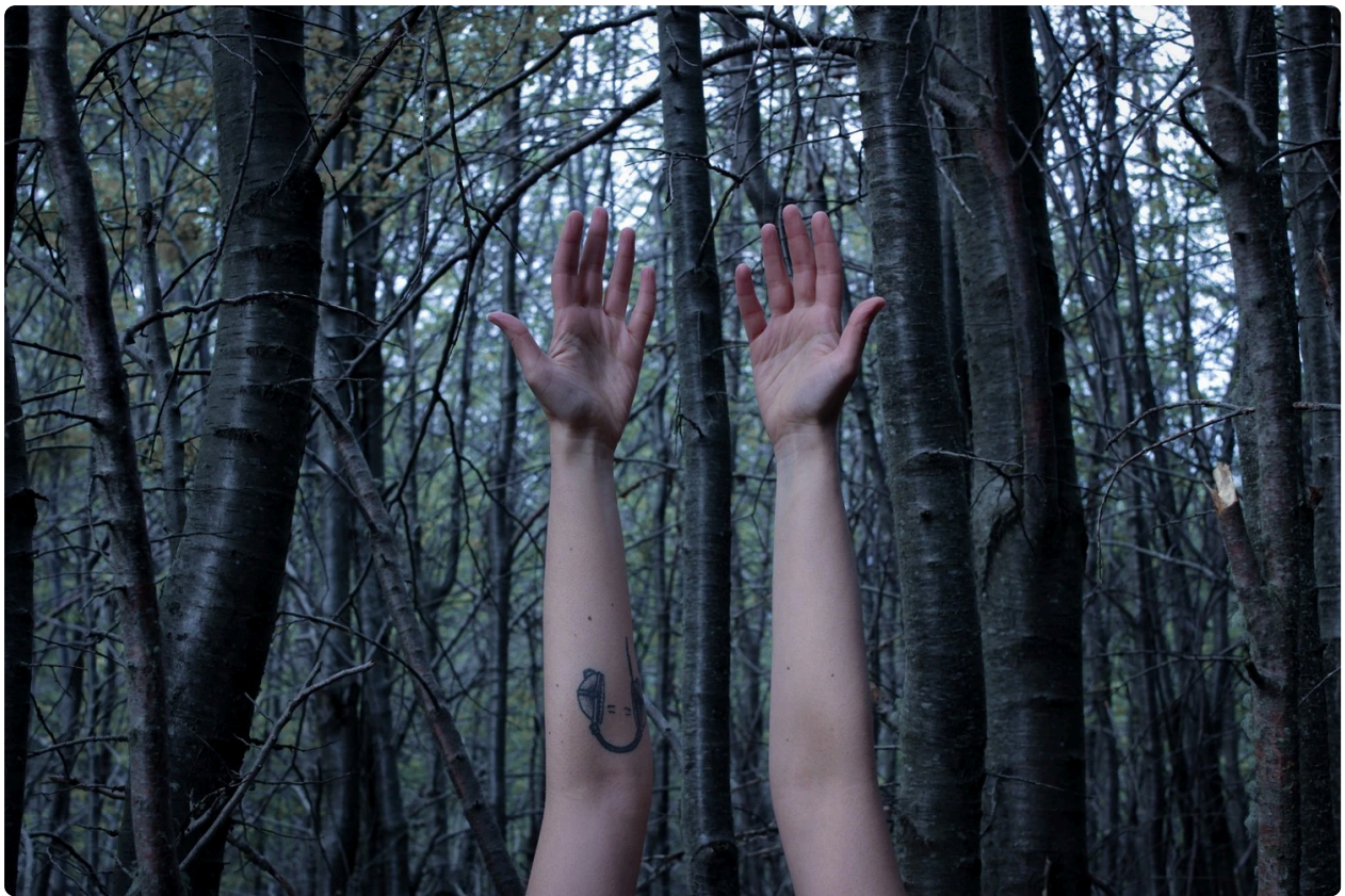
La reconstrucción de los cuerpos, Florencia Díaz (Todos los derechos reservados)