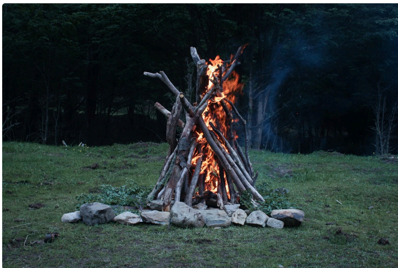
La reconstrucción de los cuerpos, Florencia Díaz (Todos los derechos reservados)