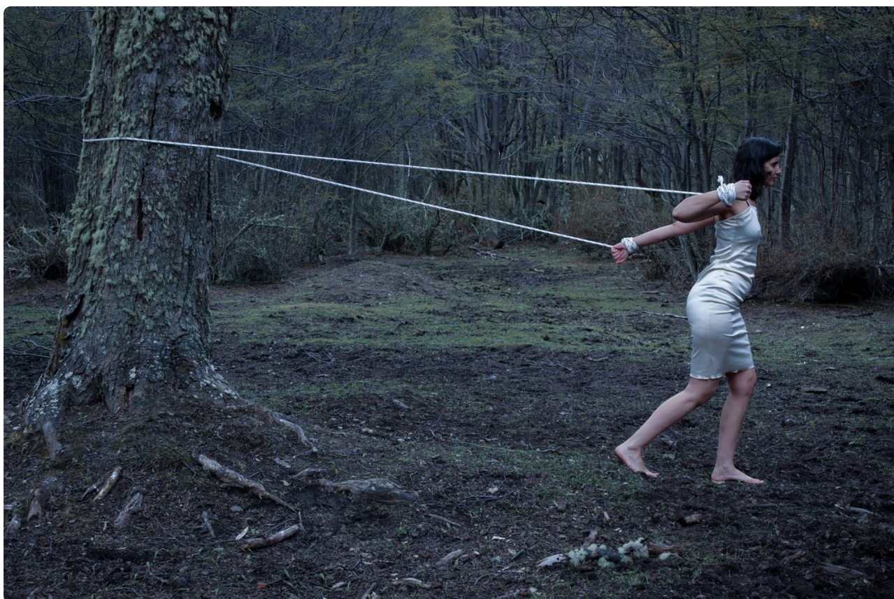
La reconstrucción de los cuerpos, Florencia Díaz (Todos los derechos reservados)