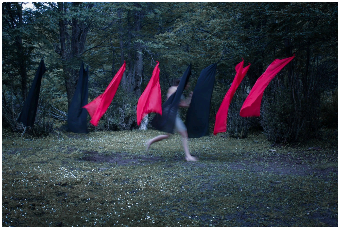
La reconstrucción de los cuerpos, Florencia Díaz (Todos los derechos reservados)