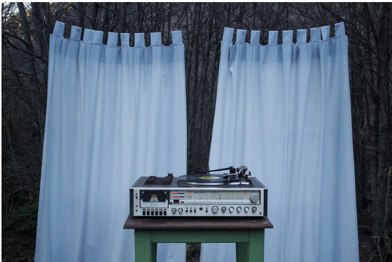
La reconstrucción de los cuerpos, Florencia Díaz (Todos los derechos reservados)