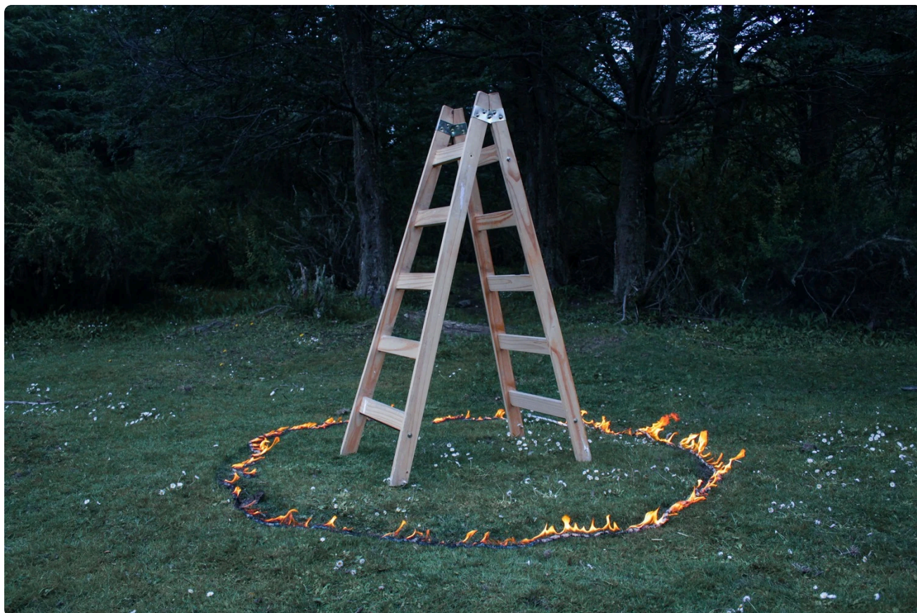
La reconstrucción de los cuerpos, Florencia Díaz (Todos los derechos reservados)