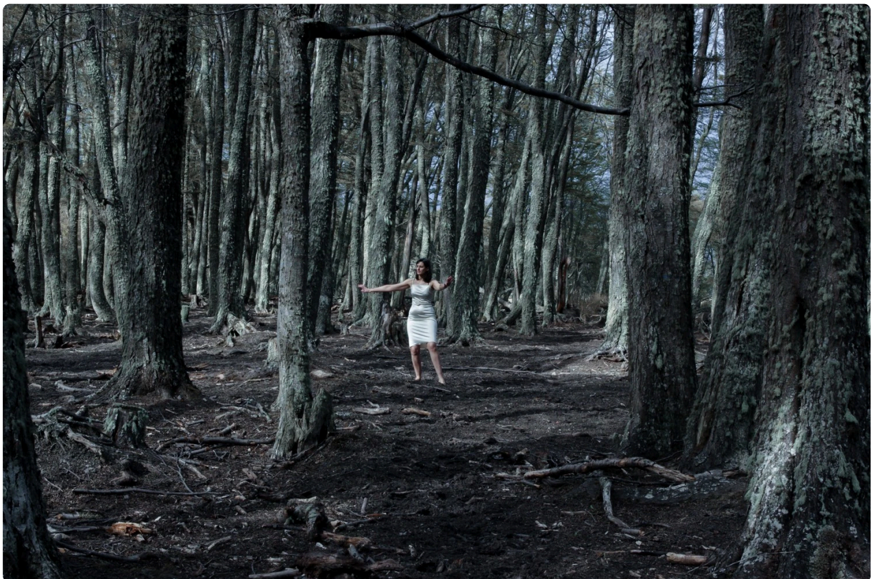
La reconstrucción de los cuerpos, Florencia Díaz (Todos los derechos reservados)