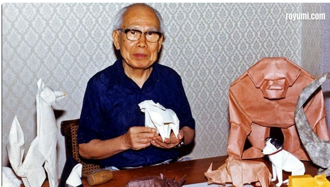
Akira Yoshizawa con sus creaciones.