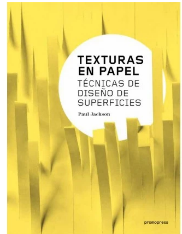
Libro de Paul Jackson "TEXTURAS DE PAPEL. TÉCNICAS DE DISEÑO Y SUPERFICIES. La portada del libro es con tiras de papel amarillo con un círculo blanco en el medio donde está el nombre y el autor del libro.

* Eric Gjerde (Reino Unido): patrones táctiles (tessellations) usados en educación sensorial.