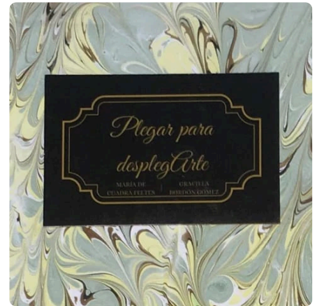
Portada del libro "Plegar para Desplegararte".

Un caso para destacar es el libro "Plegar para DesplegarArte" de Graciela Bordón, que brinda la maravillosa experiencia del origami a personas con discapacidad visual aunque también es accesible para cualquier persona que desee aprender origami.