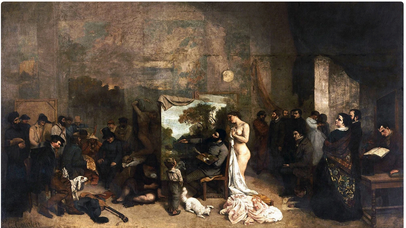
El taller del pintor. Alegoría real que determina una fase de siete años de mi vida artística y moral (1855)

Gustave Courbet, protagonista de La Comuna de París