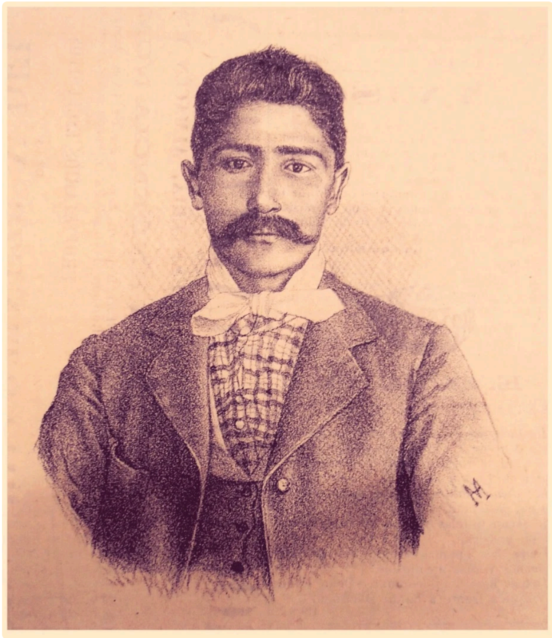
Jesús Mugas, dibujo en diario La Libertad, abril de 1903

Algunos bandidos rurales adquirieron fama vinculada a ideales de resistencia y valor, al arquetipo de una reivindicación frente a los innegables abusos de un estado que, si no tenía del todo la vaca atada, se aprestaba a cerrar el moño a comienzos del siglo veinte.