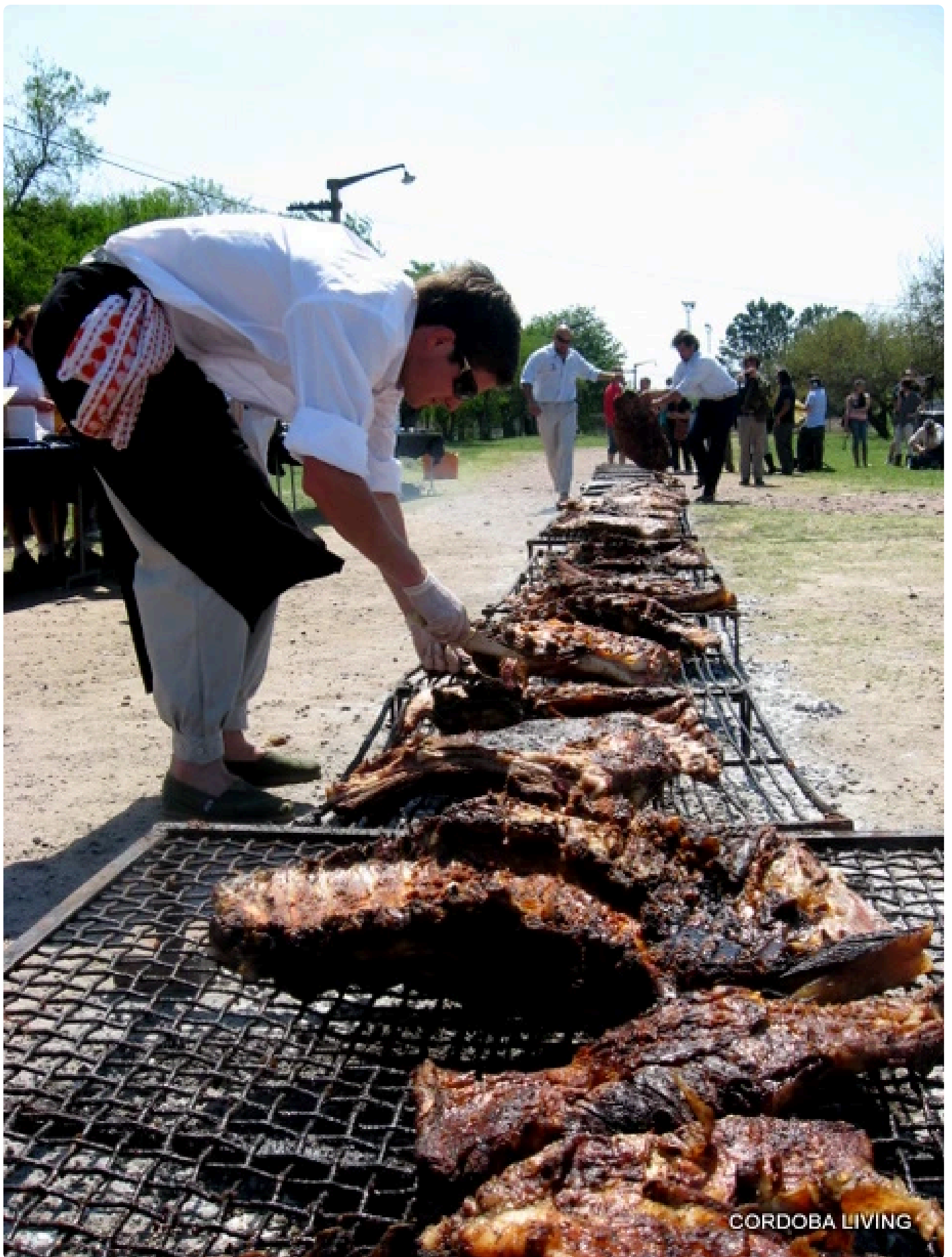
Rirkrit Tiravanija preparando la obra del asado