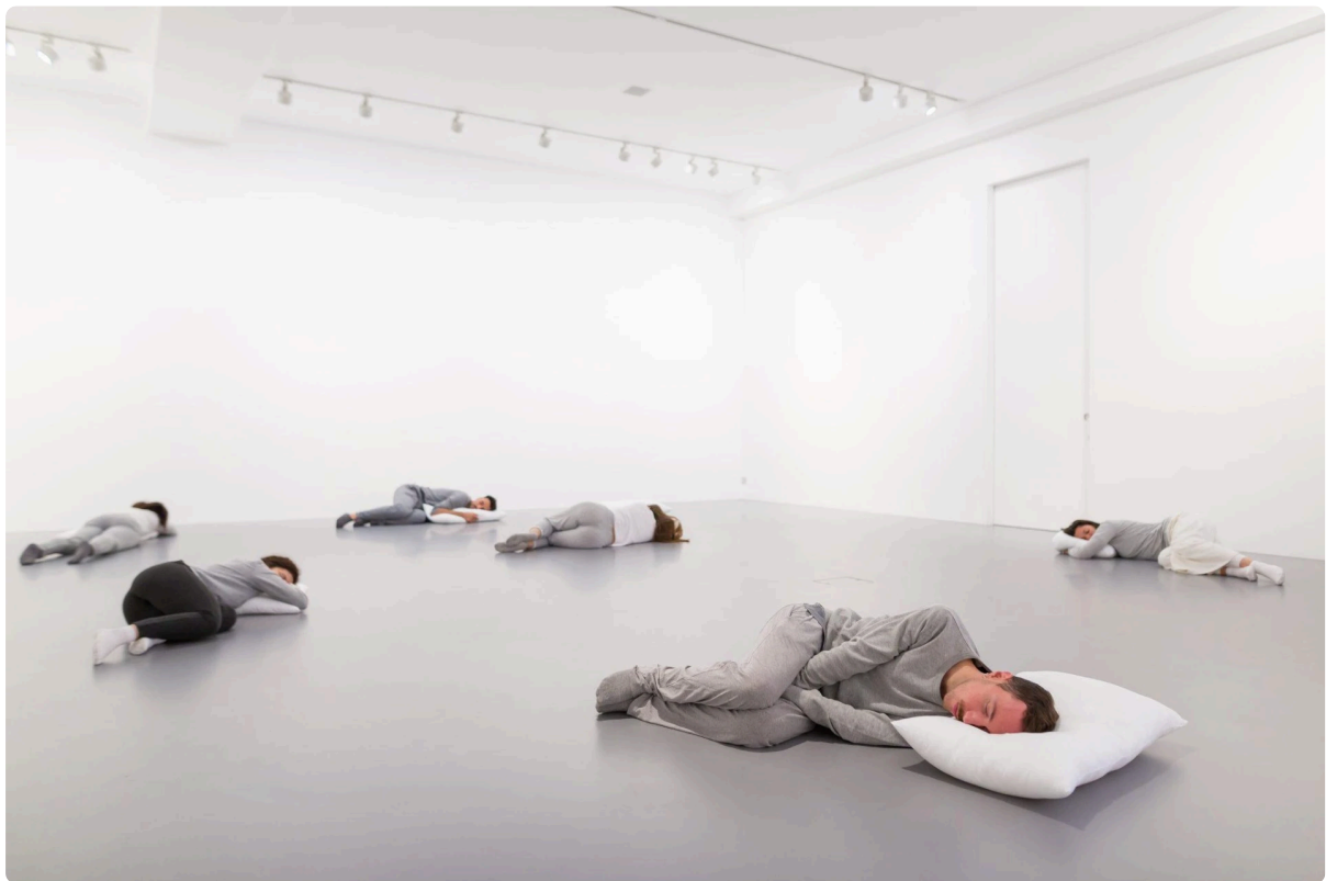
Sleeping Sickness (La enfermedad del sueño) - Pratchaya Phinthong

Primavera del 2010 en Córdoba, se inaugura el ¡Afuera! , un evento artístico salido de las entrañas del Centro Cultural España Córdoba que prometía revolucionar el campo del arte local y en el que participaron más de 100 artistas de distintos lugares del mundo; algunos de ellos con altos pergaminos en el circuito del arte internacional.