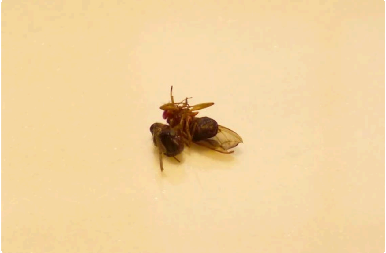
This Variation - Tino Sehgal

JT - Realmente es difícil ser categórico y justo con el arte contemporáneo. Nada parece rozarse con nada. Hay una suerte de democracia general, una especie de convivencia en la proliferación. Pero ese manto de dignidad y distancia es falso. Las obras siguen siendo estructuras, entran en conflicto, tienen bordes y formulaciones que a veces son correctas y a veces infelices.