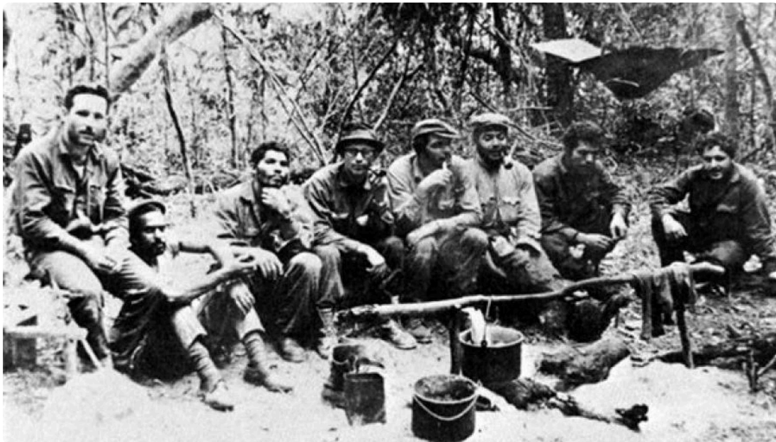
Integrantes de la guerrilla del Che

Pero la evocación de la sombra terrible de Sarmiento, en realidad, nos remite a otra de sus inquietudes, acaso a su pregunta más importante, la que estructura su Facundo : ¿Por qué la revolución (de 1810) se transfiguró en guerra civil? Pregunta inversa a la que se convirtió en el programa de Lenin tras su lectura de la derrota de la Comuna de París: transfigurar la guerra civil en revolución.