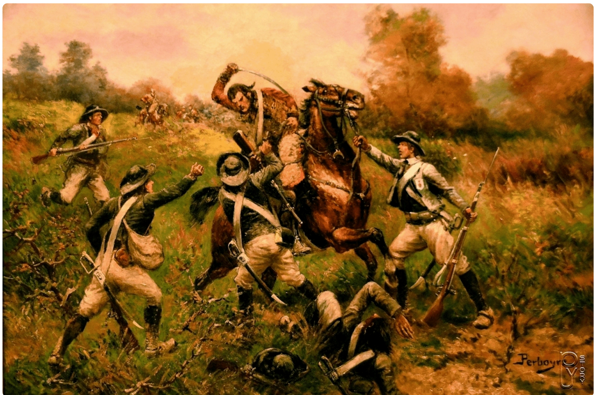
Guerra de Vendée. Enfrentamiento entre vendeanos y caballería republicana. Autor Paul-Emile-Léon Perboyre (arrecaballo.es)