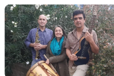
La Ira de Atahualpa