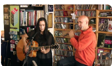
Con Julieta Venegas